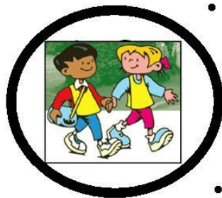
Добра подготовка добар ученик

Вистинската подготовка за училиште се состои во тоа децата да ја разберат својата непосредна околина, да го развијат чувството на одговорност за своите постапки и да имаат постојана поддршка од возрасните, како и да имаат богато развиена фантазија и да играат.